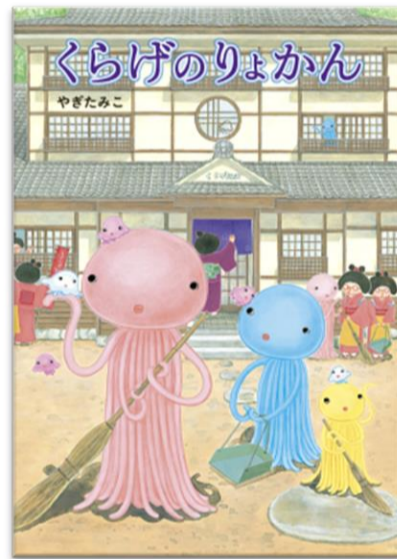
『くらげのりょかん』