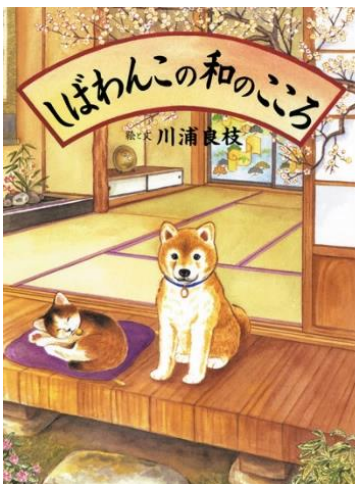
『しばわんこの和のこころ』 かわらよしえ 川浦良枝／絵と文 白泉社