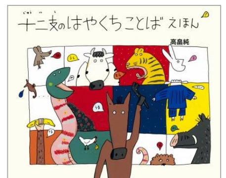
『十二支のはやくちことばえほん』 たかはしじゅん 高畠純／作 教育画劇