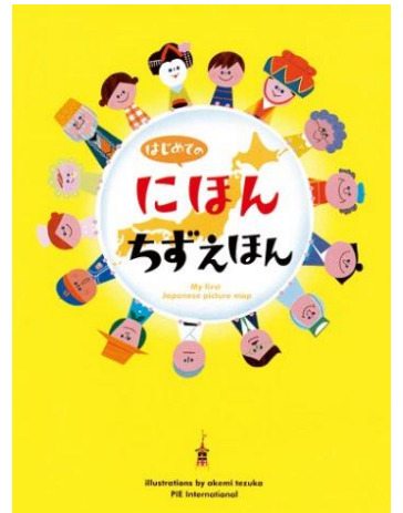
『はじめてのにほんちずえほん』 てづかあけみ／絵 パイインターナショナル