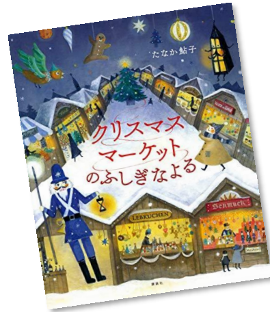
『クリスマスマーケットのふしぎなよる』