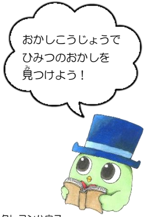
『ひみつのおかしだ おとうとうさぎ!』 ヨナ・ビヨルンシェーナ/作 椋谷瑠子/訳 クレヨンハウス