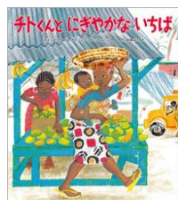
『チトくんとにぎやかないちば』

アティヌーク／文 アンジェラ・ブルックスバンク／ 絵 さくまゆみこ／訳 徳間書店