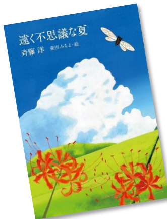
『遠く不思議な夏』 斉藤洋／著 森田みちよ／絵 偕成社