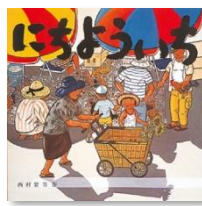
『にちよういち』 西村繁男／作 童心社

高知市に住むあつちゃんとおばあちゃんは、ある夏の朝、にちよういちに出かけます。日曜日にたつ市なので、にちよういちといいます。さあ何を賣うかな？ だれに会うかな？