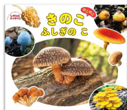
『きのこのこのこふしぎのこ』 しろずたかし / 監修 白水貴 / 監修 ひさかたチャイルド 474

秋になったらきのこ料理を食べよう! ふだん食べているきのこはどんなふうに見えるのかな? カラフルなきのこや、毒のあるきのこ、きのこをたくさん紹介。