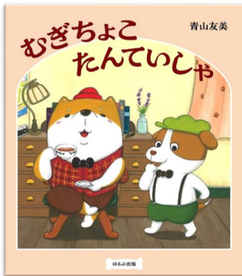
『むぎちよこたんていしや』 あおやまともみ 著 ほるぷ出版