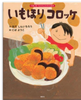
『いもほりコロッケ』 おだしんいちろう / 文 こばようこ / 絵 講談社

今日はじゃがいも掘り。大きなじゃがいもを掘ってきたまきおくんは、家に帰ってお母さんとコロッケを作ります。これを読んだらあなたもきっとコロッケを作りたいくなる!