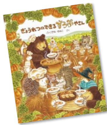
『ぎょうれつのできるすうぶやさん』 ふくざわゆみこ/さく 教育画劇