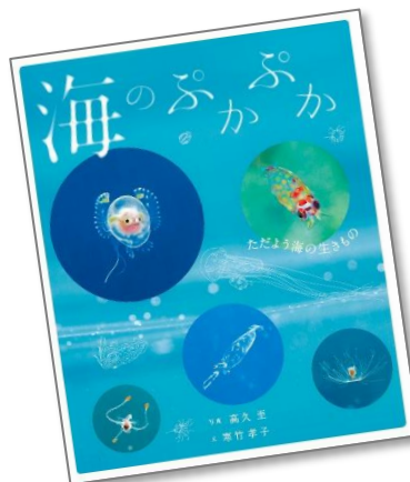
『海のふかふか -ただよう海の生きもの-』 高久至 / 写真 寒竹孝子 / 文 アリス館