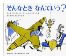
セシル・ジョスリン / 文 モーリス・センダック / 絵 たにかわしゅんたろう / 訳 岩波書店